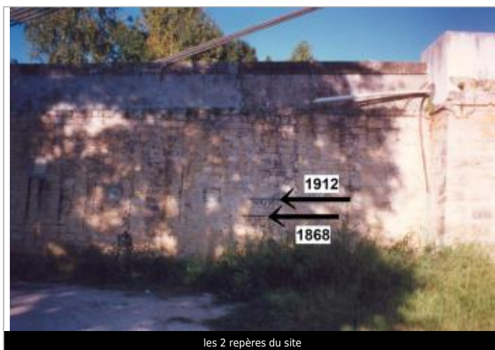
les 2 repères du site