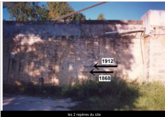
les 2 repères du site

Coordonnées WGS84 : X: 0.43797800 / Y: 44.37370000