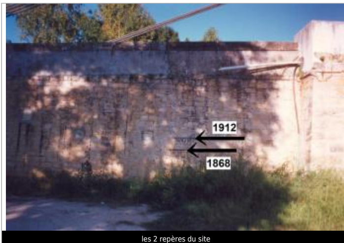
les 2 repères du site