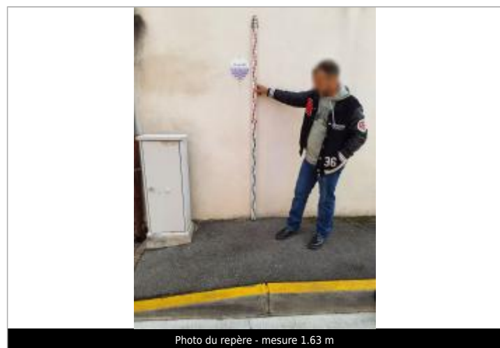
Photo du repère - mesure 1.63 m

GÉNÉRAL Code : GTL_R_633 Date de mise à jour : 06/08/2025 Auteur : SPC GTL