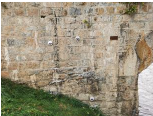
Repère normalisé. 2022

Différence entre le niveau d'eau et la référence (en m) : 2.400 m