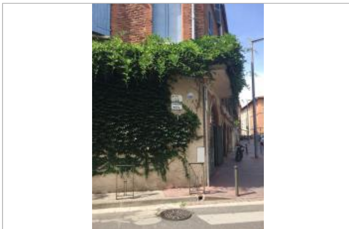
Vue du site (2018)