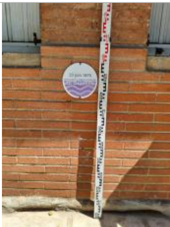
Photo du repère - mesure 0.91 m

Altitude calculée de l'eau (en m) : 140.434 m