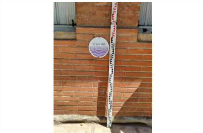
Photo du repère - mesure 0.91 m