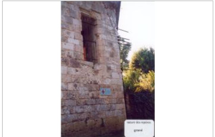
Photo des repères