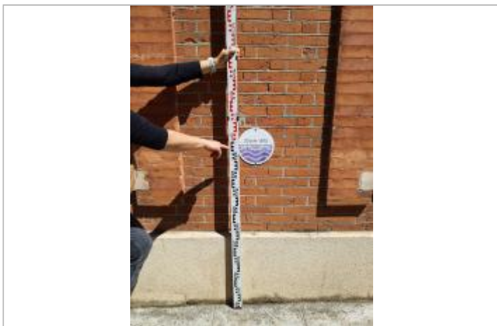
Photo du repère - mesure 0.97 m

Altitude calculée de l'eau (en m) : 140.613 m