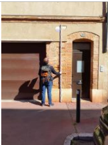
Photo du repère - mesure 2,88 m