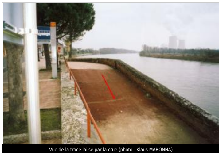
Vue de la trace laissée par la crue

Différence entre le niveau d'eau et la référence (en m) : 8.000 m