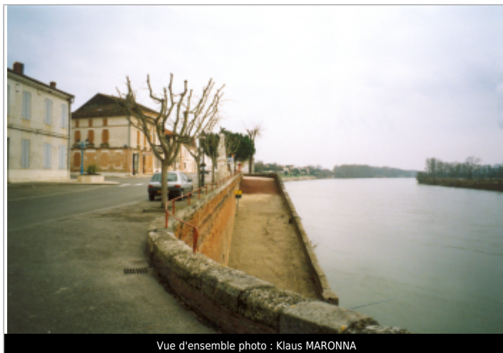
Vue d'ensemble

Coordonnées WGS84 : X: 0.82456458 / Y: 44.12333100