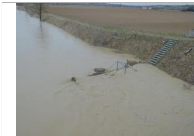
Vue vers l'amont