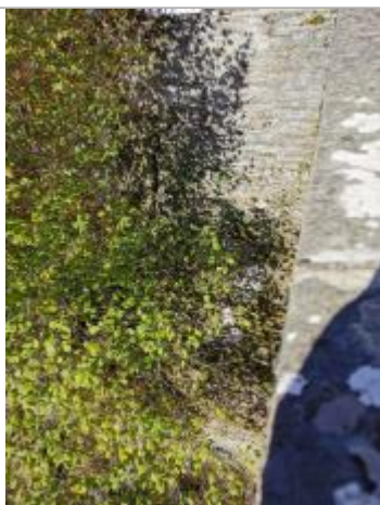
Repère normalisé. 2022

Altitude calculée de l'eau (en m) : 570.41 m