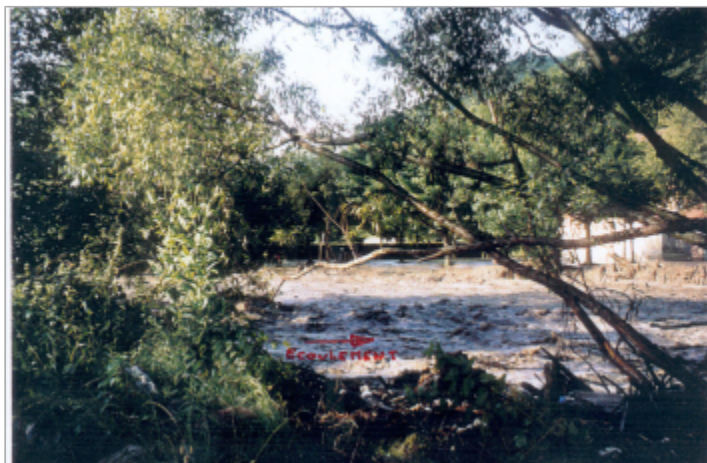
Photo du recensement d'origine.