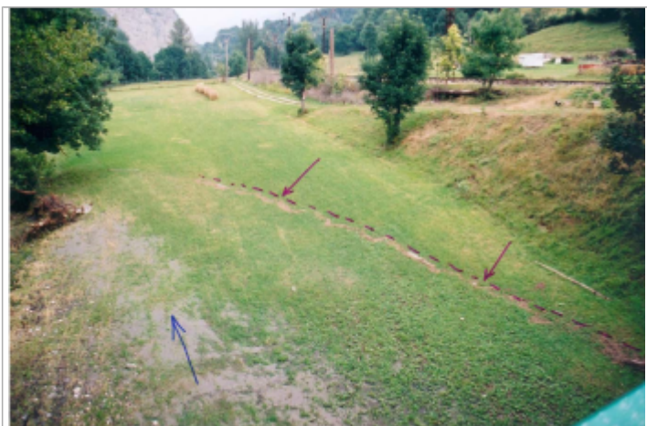
Laisses végétales dans la prairie