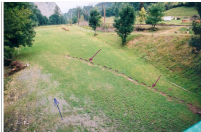
Laisses végétales dans la prairie

Coordonnées WGS84 : X: 0.37387500 / Y: 42.94550000