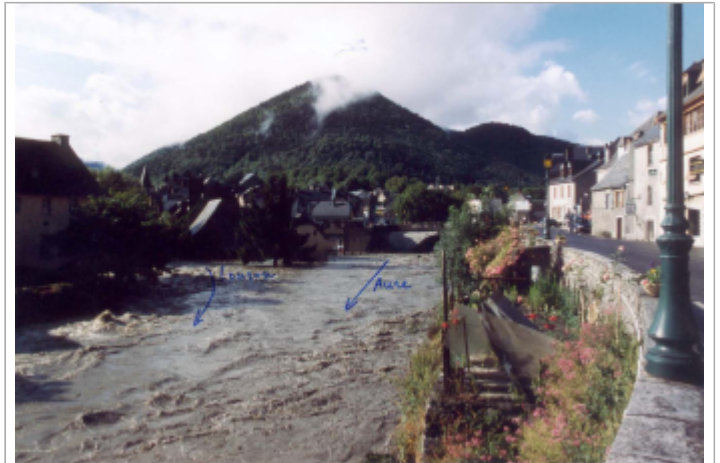
Photo du recensement d'origine.

Coordonnées WGS84 : X: 0.35747800 / Y: 42.90650000