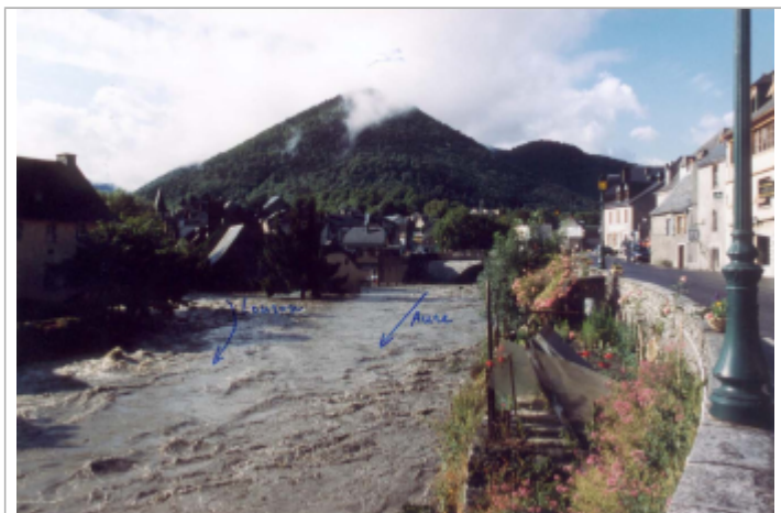
Photo du recensement d'origine.

Système altimétrique : NGF IGN 1969 (système normal)