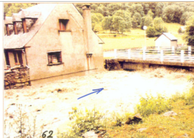
Photo du recensement d'origine.

Coordonnées WGS84 : X: 0.39223700 / Y: 42.87600000