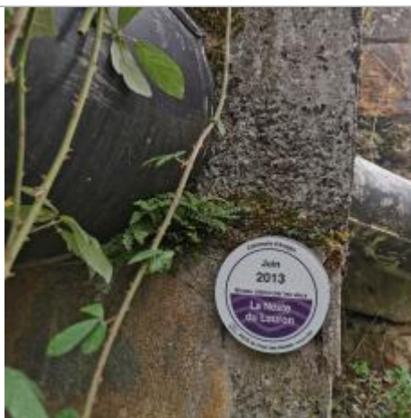
Repère normalisé. 2022

Système altimétrique : NGF IGN 1969 (système normal)