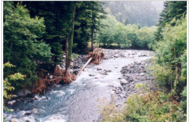
Photo du recensement d'origine.