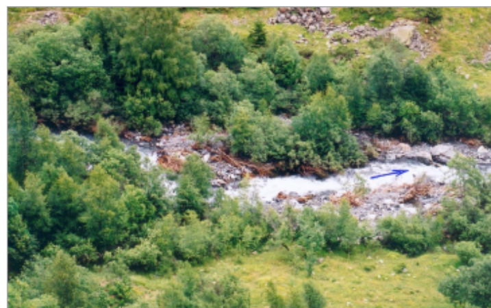
Laisses végétales d'une crue manifestement non exceptionnelle

GÉNÉRAL Code : GTL_R_5031 Date de mise à jour : 24/04/2018 Auteur : SPC GTL