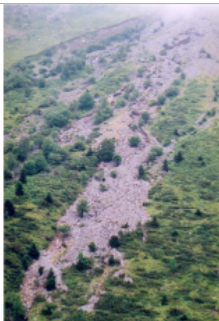
Ravinements sur le versant sud de la crête de Traouès

Système altimétrique : NGF IGN 1969 (système normal)