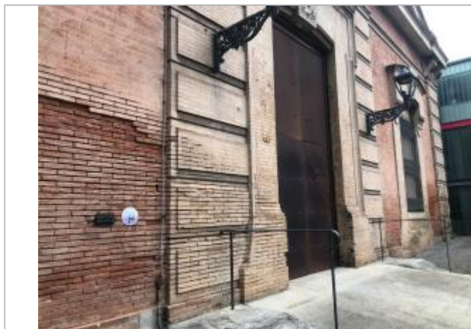
Repère historique remplacé et macaron