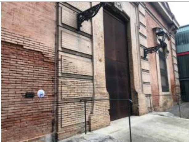
Repère historique remplacé et macaron

Altitude calculée de l'eau (en m) : 137.18 m