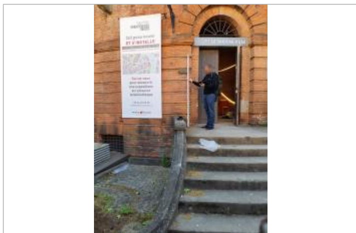
Photo du repère - mesure 1,63 m

Altitude calculée de l'eau (en m) : 139.919 m