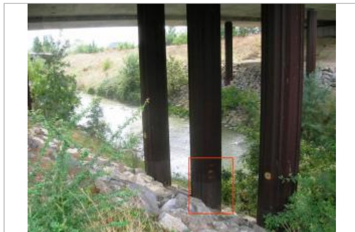
Vues des repères