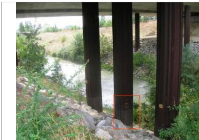
Vues des repères

Coordonnées WGS84 : X: 1.47826000 / Y: 43.63910000