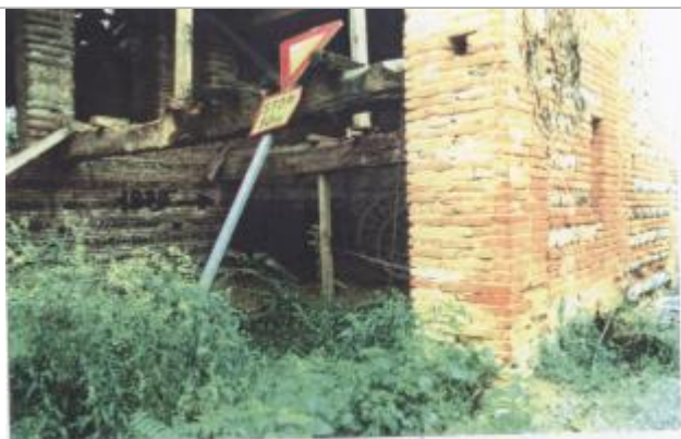
(24422) Commune de Saubens (RD) : laisse de crue peu sure de 1875 cote : 160,66 mNGF

Altitude calculée de l'eau (en m) : 158.32 m