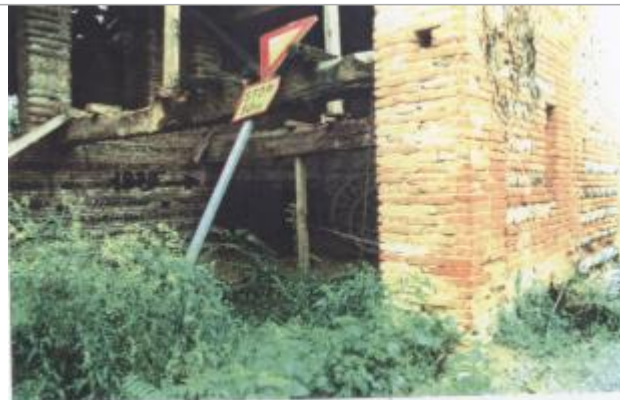
(24422) Commune de Saubens (RD) : laisse de crue peu sure de 1875 cote : 160,66 mNGF

Photo du recensement d'origine.