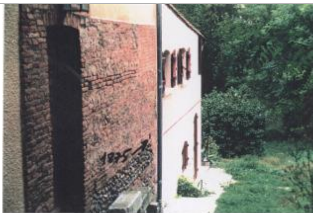
99) Commune de Muret (RD) : laisse de crue de 1875 (171,08 mNGF)

Altitude calculée de l'eau (en m) : 171.08 m