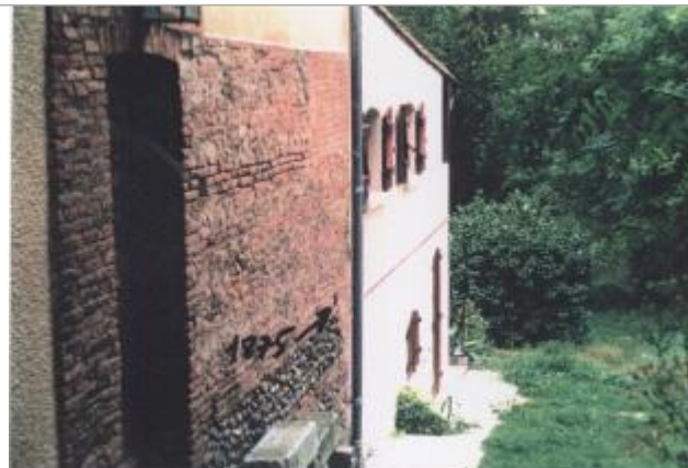
99) Commune de Muret (RD) : laisse de crue de 1875 (171,08 mNGF)

Photo du recensement d'origine.