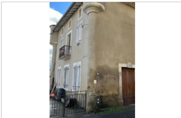
Ancien moulin de Bonrepaux