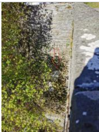
Repère normalisé. 2022

Altitude calculée de l'eau (en m) : 570.71 m