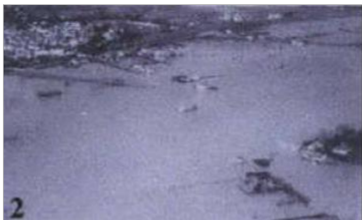
Photo du recensement d'origine, auteur photo : Risque et Territoire