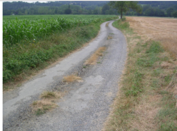
Trait peint sur la route aujourd'hui disparu. Localisation approximative au centre de la photographie. GEOSPHAIR

Coordonnées WGS84 : X: 0.97413004 / Y: 43.06864000