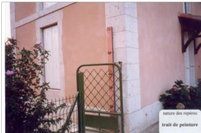
Photo des repères