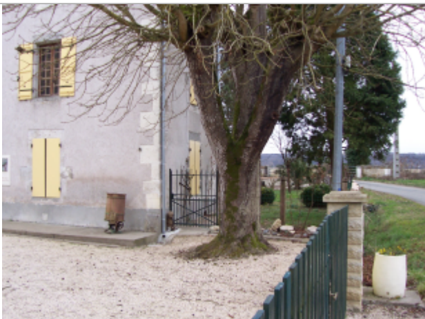
Photo du recensement d'origine, auteur photo : Risque et Territoire

Altitude calculée de l'eau (en m) : 36.2 m