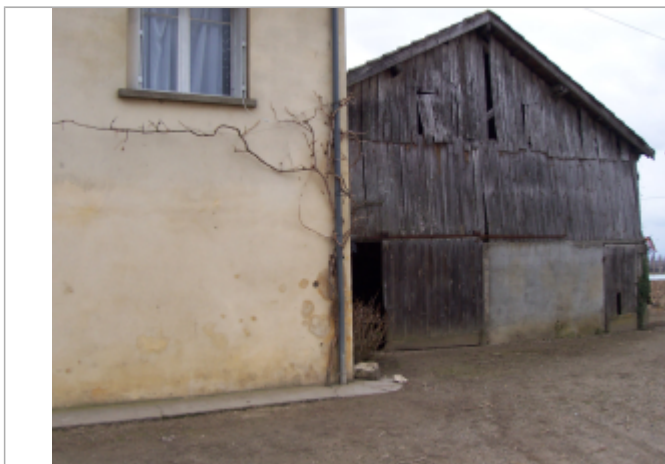
Photo du recensement d'origine, auteur photo : Risque et Territoire

Altitude calculée de l'eau (en m) : 34.63 m