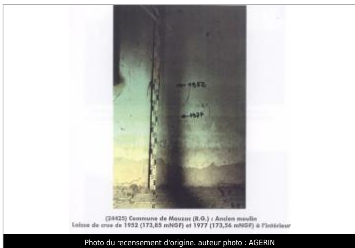
(24425) Commune de Mauzac (R.G.) : Ancien moulin Laisse de crue de 1952 (173,85 mNGF) et 1977 (173,56 mNGF) à l'intérieur

Altitude calculée de l'eau (en m) : 173.85 m