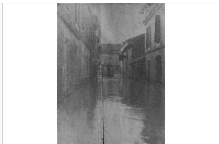
Vue vers le sud depuis le n°3 de la rue Sadi Carnot

Code : GTL_R_1957 Date de mise à jour : 28/04/2020 Auteur : SPC GTL