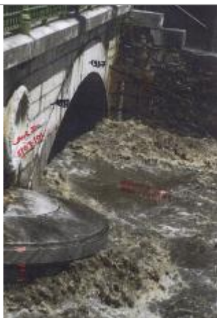
Vue des repères

Système altimétrique : NGF IGN 1969 (système normal)