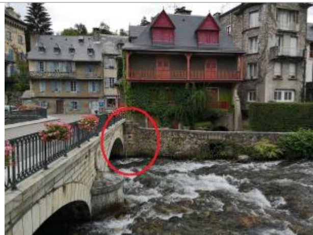
Vue du site, 2023.