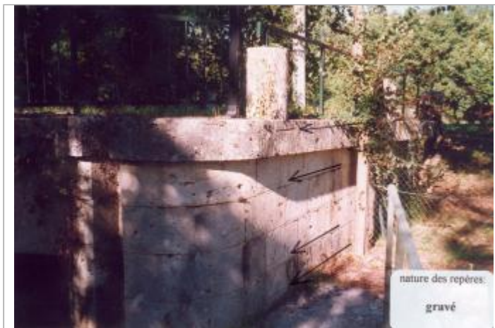
Photo des repères