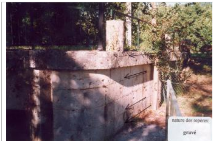
Photo des repères