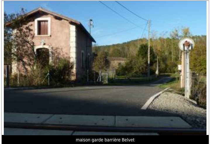
maison garde barrière Belvet