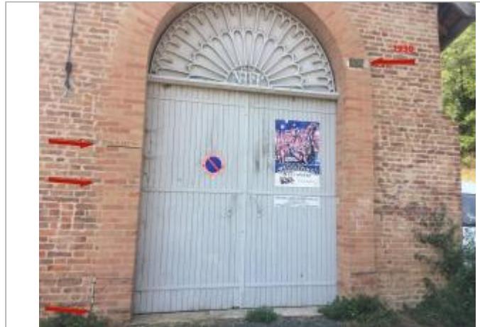
Vue des repères