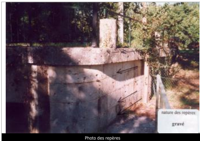
Photo des repères