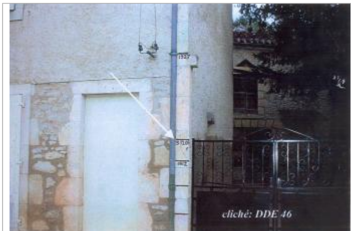
Photo des repères