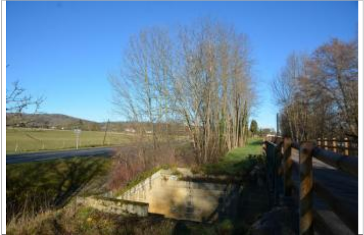
site Pont Lesponne sous l'ancienne voie ferrée