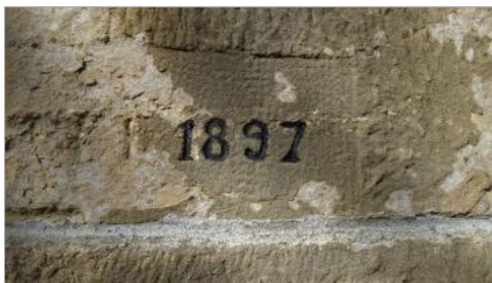
Photo du repère rénové.