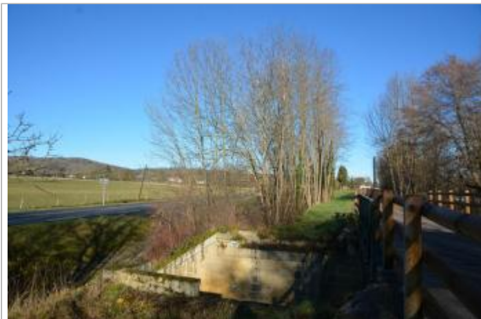
site Pont Lesponne sous l'ancienne voie ferrée