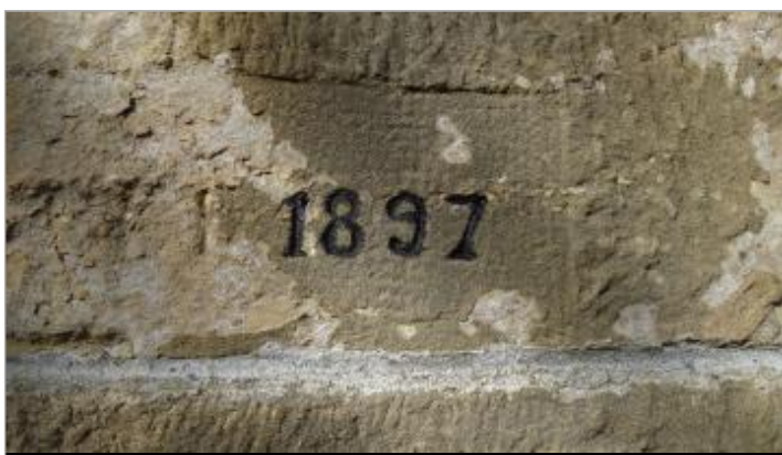
Photo du repère rénové.