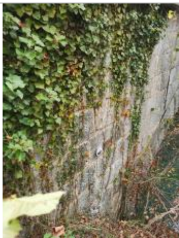
Repère normalisé. 2022

Altitude calculée de l'eau (en m) : 585.07