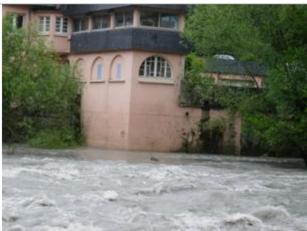
Vue de la façade

Système altimétrique : NGF IGN 1969 (système normal)