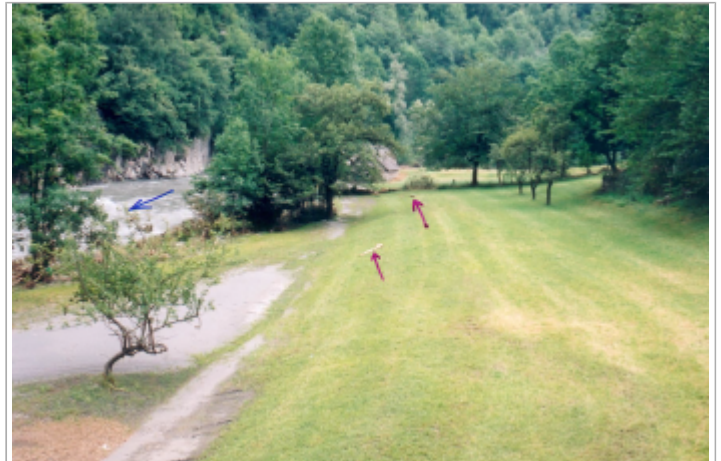
Photo du recensement d'origine.

Coordonnées WGS84 : X: 0.37605500 / Y: 42.94990000