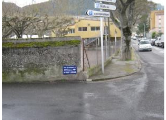
Photo du recensement d'origine, auteur photo : SPC Garonne Tarn Lot

Coordonnées WGS84 : X: 3.08600000 / Y: 44.09840000