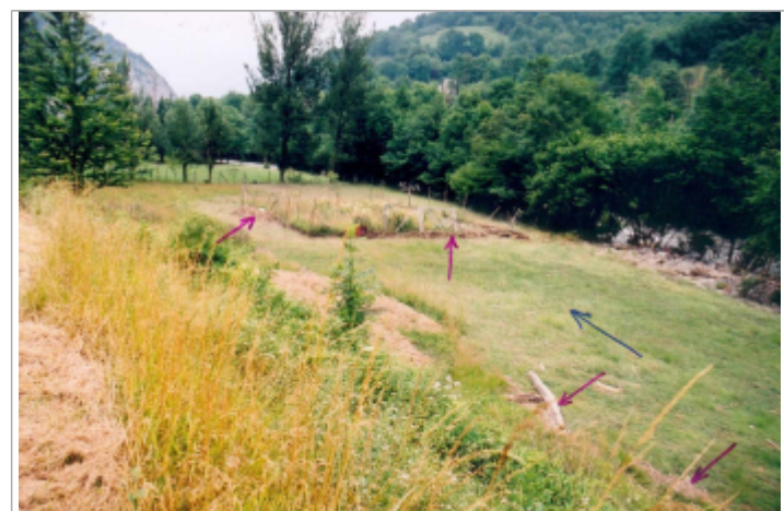
Laiesses végétales dans la clôture

GÉNÉRAL Code : GTL_R_5093 Date de mise à jour : 19/02/2018 Auteur : SPC GTL