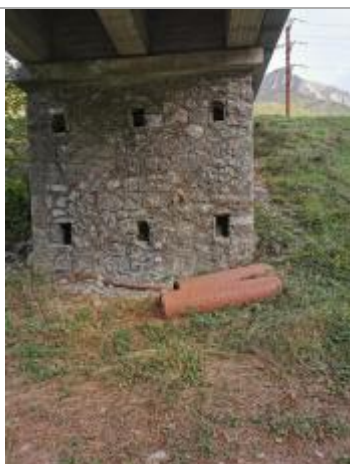
Repère normalisé. 2022

Système altimétrique : NGF IGN 1969 (système normal)