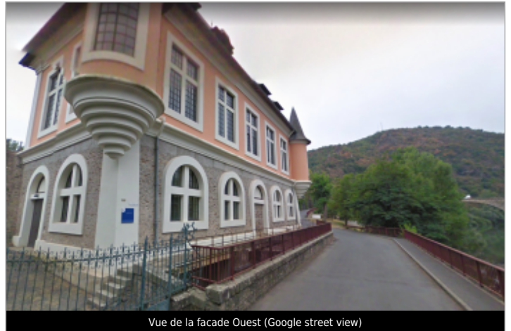
Vue de la facade Ouest