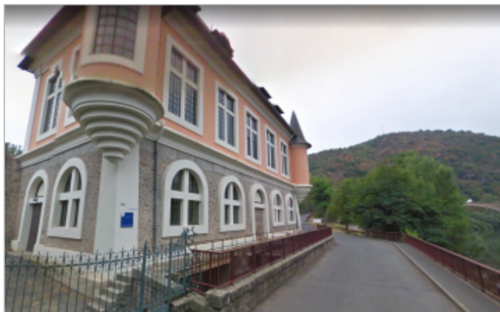
Vue de la facade Ouest