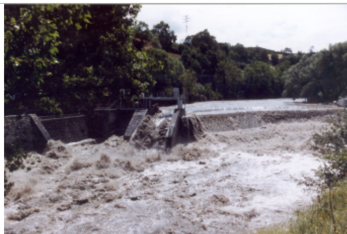
Photo du recensement d'origine.