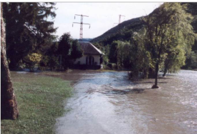
Photo du recensement d'origine.

Système altimétrique : NGF IGN 1969 (système normal)