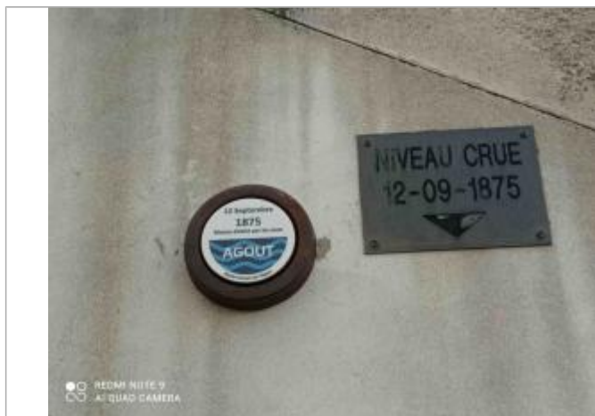
Repère de crue 12 septembre 1875 vue de près

Système altimétrique : NGF IGN 1969 (système normal)